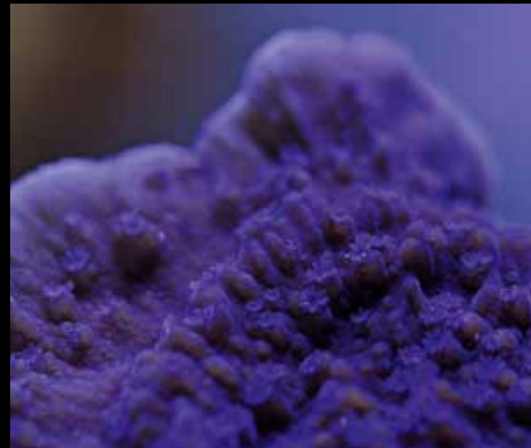
Op deze macrofoto zijn de poliepen die voor de paarse kleur zorgen goed zichtbaar.

Elke week wordt een waterverversing van 5 tot 10% toegepast. Christiaan voert de dieren dagelijks afwisselend droogvoer (vlok en korrel) en verschillende diepvriesvoerders. Supplementen om de carbonaathardheid en calcium- en magnesiumconcentraties op peil te houden, worden nu nog handmatig toegevoegd.