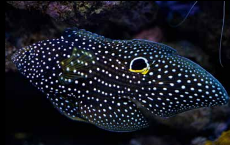
Calloplepsiops altivelis . Deze aantrekkelijke verschijning heeft een tweede ‘oog’ waardoor hij 50% meer kans heeft om zijn ‘kop’ te behouden bij een aanval van een predator. Opvallend is dat zijn echte oog zelfs met witte stippen gecamoufleerd is.

De verlichting bevat twee TMC 1500 LN led-lampen, die worden aangestuurd door een computer. De ledverlichting is bevestigd op een rail en kan eenvoudig worden uitgebreid door er