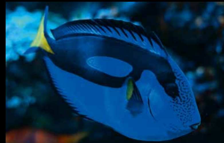
Paracanthus hepatus . De Picasso-doktersvis heeft zijn naam te danken aan zijn koningsblauwe lichaam met gele staart die als op een schilderspalet nog eens extra is versierd met zwarte banen.